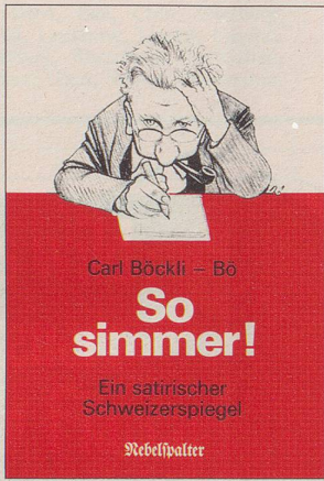
Carl Böckli – Bö So simmer! Ein satirischer Schweizerspiegel Nebelspalter