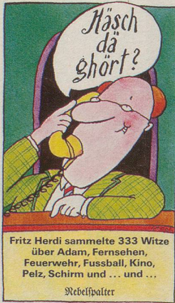
Fritz Herdi sammelte 333 Witze über Adam, Fernsehen, Feuerwehr, Fussball, Kino, Pelz, Schirm und ... und ... Nebelspalter

Augenfällig an dieser Sammlung – und auch für den Kenner wieder aufs neue überraschend – ist die verblüffende Einheit von Bild und Vers in Bös Blättern mit jenem einzigartigen Schweizer «Überdialekt» Böscher Prägung, der während vieler Jahre auch charakteristisch für unsere Cabarets wurde. Und so zeigen denn die 140 Blätter dieses Bandes Bö auch als späten Nachfahren jener Moritatensänger, die auf den Dorf- und Marktplätzen ihre Bilder zeigten und dazu ihre Verse sangen – dem Volk aufs Maul schauend.