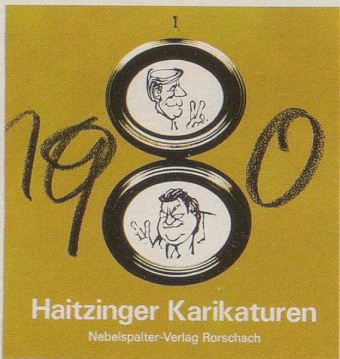
Haitzinger Karikaturen Nebelspalter-Verlag Rorschach