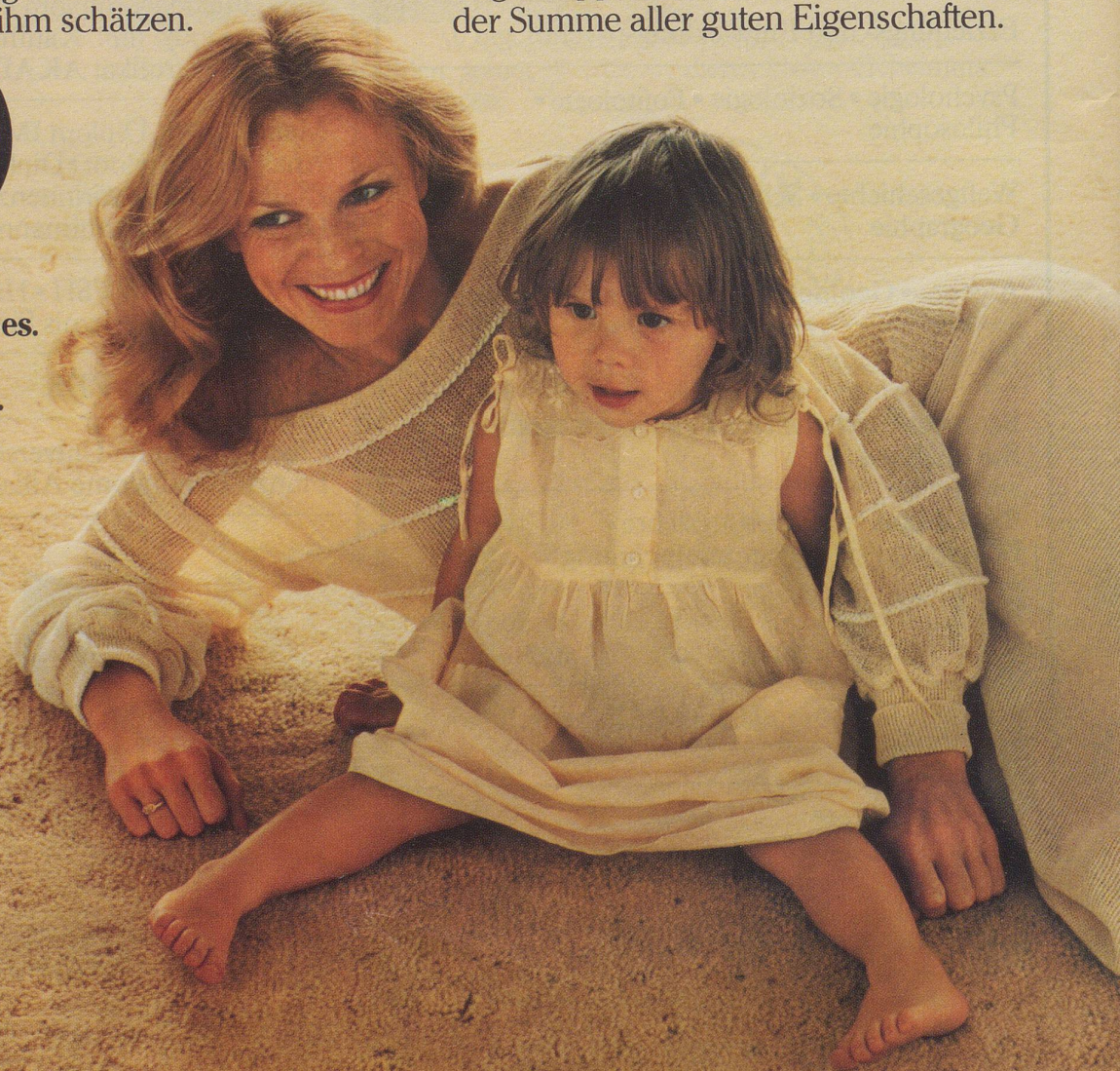
Das Foto: Ein Wollsiegel-Teppichboden, Art. Mira Natur, Farbe weiss, von Möbel Pfister AG, 5034 Suhr.

Internationales Woll-Sekretariat Düsseldorf-Wien-Zürich