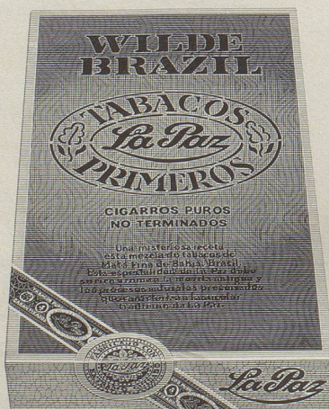
Wilde Havana und Wilde Brazil von La Paz Die oft kopierte, doch nie erreichte Wilde. Einzigartig im Aroma. Aus Tabak, mehr nicht. 5 Stück Fr. 3.—