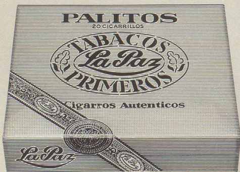
Cigarillos Palitos von La Paz Einfach und gut. Gehaltvolle Cigarillos für jede Tageszeit. Viel Aroma für wenig Geld. 20 Stück nur Fr. 4.80