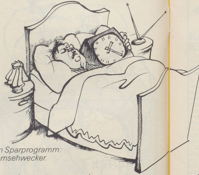
Neu im Sparprogramm: Der Fernsehwecker.