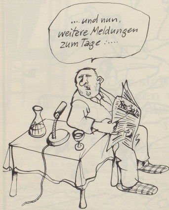
Die Tagesschau kann einfacher und zudem volksnäher gestaltet werden.