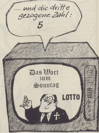
Kurzsendungen könnten zusammengelgt werden.