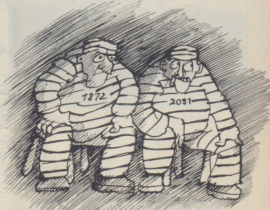
«Die werden doch nicht etwa bei der Sendung (XY) sparen wollen!»