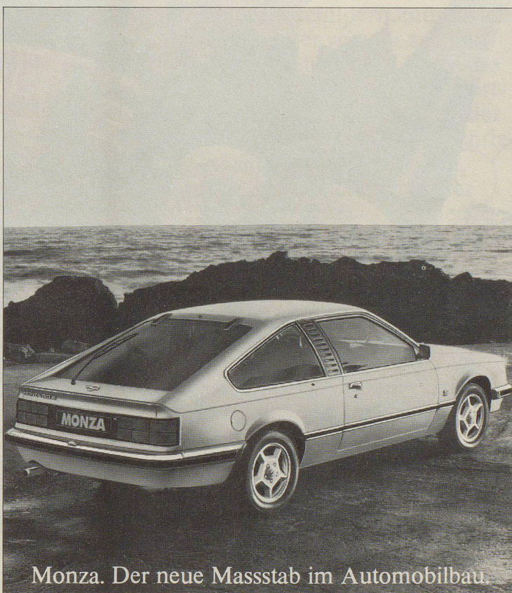
Monza. Der neue Massstab im Automobilbau.

Deshalb bietet er einerseits viel Innenraum, eine komplette Ausstattung und eine praktische Hecktüre. Andererseits ein 3.0-l-Reihentriebwerk mit 6-Zylindern, L-Jetronic-Einspritzung und 180 PS, deren Kraft Sie spüren, aber nicht hören. Dazu ein 5-Gang-Getriebe. Und