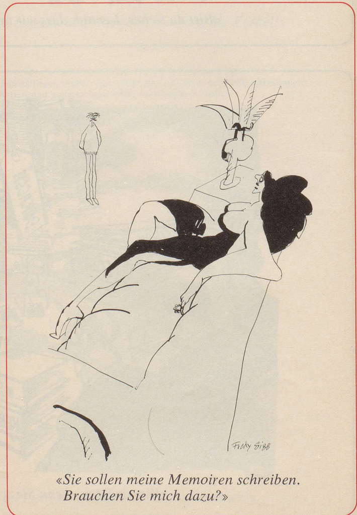
«Sie sollen meine Memoiren schreiben. Brauchen Sie mich dazu?»