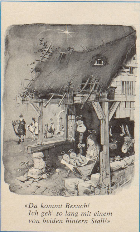
«Da kommt Besuch! Ich geh' so lang mit einem von beiden hintern Stall!»

nicht geurteilt werden. Zur selben Zeit, da ihre Ablehnung publiziert wurde, musste in der Innenstadt von Nizza auf Intervention des französischen Innenministeriums, d. h. unter dem Druck des iranischen Botschafters in Paris, eine Karikatur Khomeinis entfernt werden. (Sie wurde durch eine Karikatur des Bürgermeisters von Nizza ersetzt.) Khomeini im Zusammenhang mit dem Karneval hatte «religiöse Gefühle verletzt». (Trotz ganz anderer Karikaturen zur selben Zeit in Teherans Strassen hat der persische Botschafter in Paris seinen Protest wohl kaum als zynisch empfunden ...)