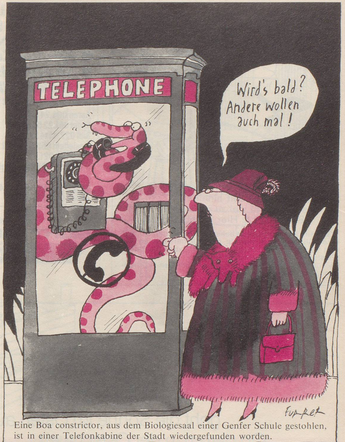
Eine Boa constrictor, aus dem Biologiesaal einer Genfer Schule gestohlen, ist in einer Telefonkabine der Stadt wiedergefunden worden.

«Es kommt noch und nöcher vor» (um mit einem «Moderator» am Radio zu reden), dass man nichts mehr schliesst, verschliesst oder abschliesst. Alles «wird dichtgemacht» in unserer Zeit. Warum, weiss niemand, so gut wie niemand zu sagen weiss, wie das Wort «Moderator» und «das Moderieren» entstanden sind. Niemand? Fridolin