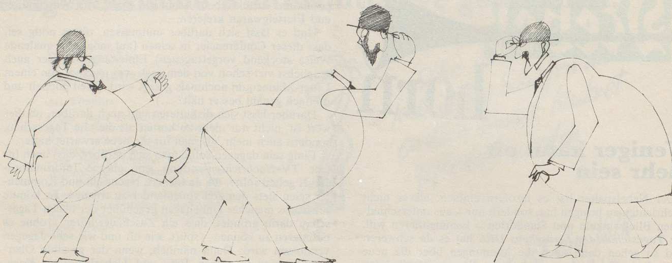
Unverhofft kommt oft