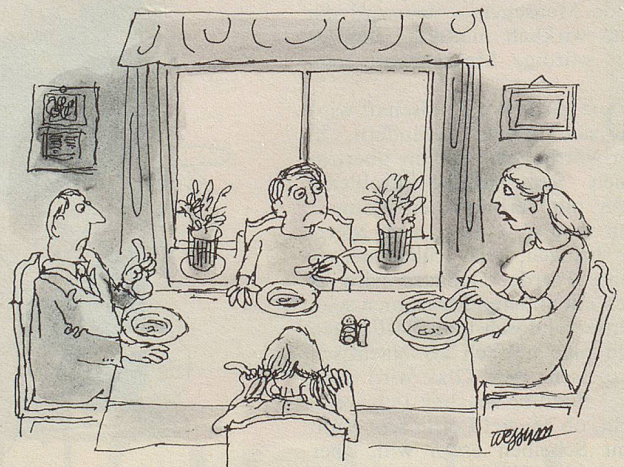
«Das ist keine wässrige Suppe, sondern eine kalorienarme, verstehst du?»

Wie erkläre ich ihr bloss, dass ihre sanfte Rebellion der ärgsten Geissel unserer Zivilisation gilt, der Hetze? Wie soll ein Kind verstehen, dass auch wir Erwachsenen ständig Gejagte sind? Mit