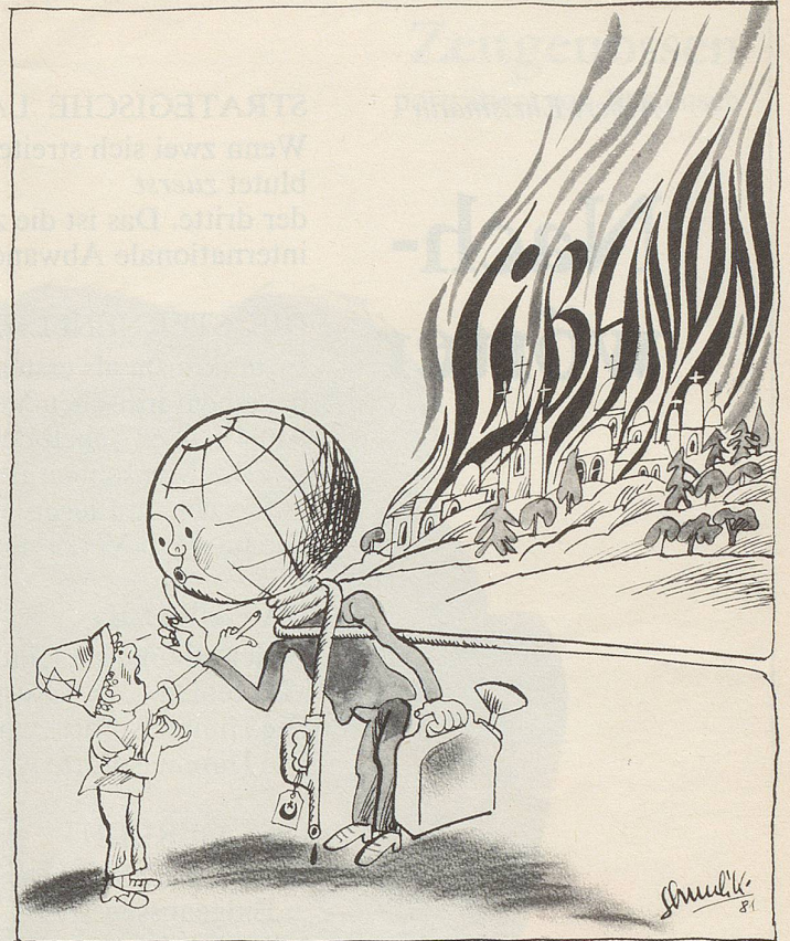
Situationsbericht aus dem Nahen Osten aus der Sicht des israelischen Zeichners Shmuel Katz

Es stimmt nicht, dass die Hungerkur-Selbstmorde der IRA-Terroristen keine Probleme lösen. Wenn die gegenwärtige Todeskadenz der Fanatiker beibehalten wird, kehrt dort spätestens nach dem Hinschied des letzten «Opfers» wieder Ruhe ein, und damit wäre doch das Hauptproblem gelöst ... Schtächmugge