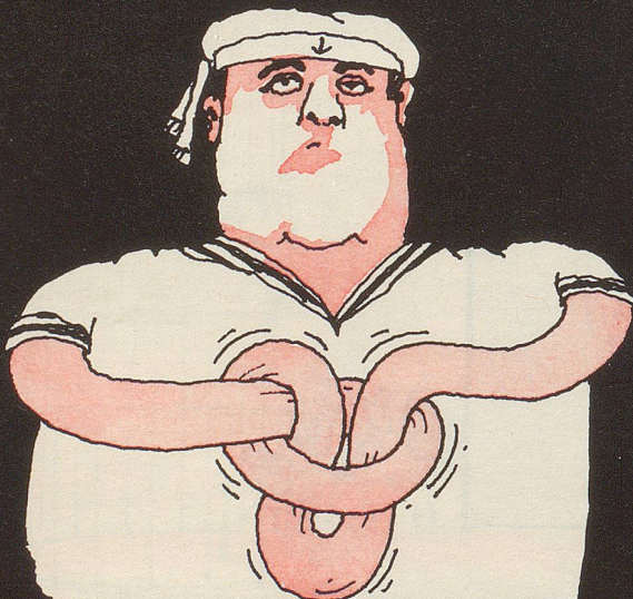
◦ Slipstek ◦