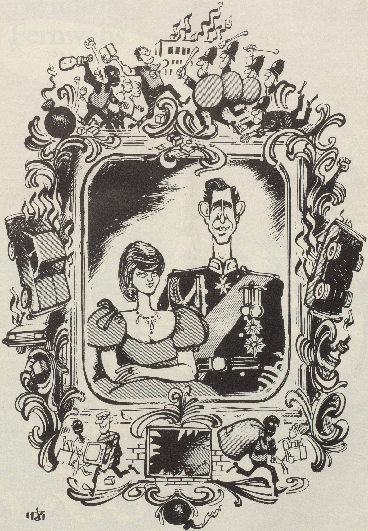
Bombenstimmung in England!