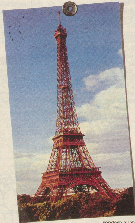
Französisch ist nicht nur die Landessprache Frankreichs, sondern auch die Muttersprache vieler Schweizer, Belgier und Kanadier.