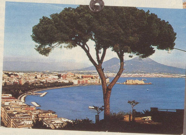
Italienisch ist nicht nur die Muttersprache der Italiener, sondern auch eine der vier Landessprachen der Schweiz.