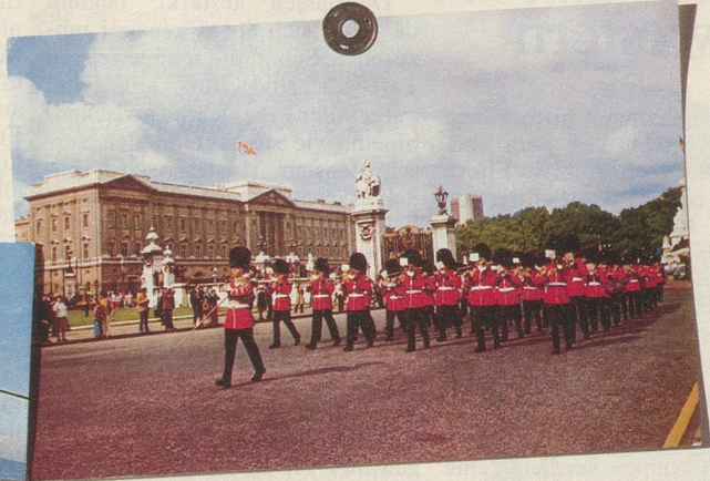
Englisch gilt als Weltsprache Nr. 1. Wer Englisch kann, ist (fast) überall zuhause.