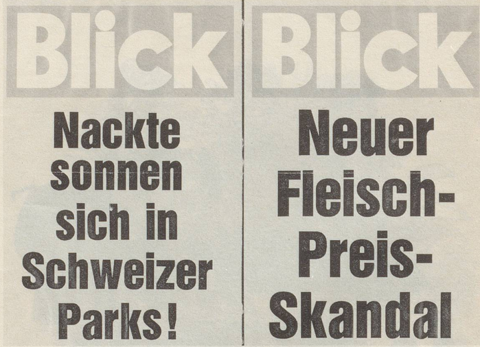
Diese zwei Aushangplakate sah ich am 19. August 1981 an einem Zürcher Kiosk. A. Bärlocher, Zürich

Me muess halt rede mit de Lüüt? Schon recht. Aber wer hört uns eigentlich noch zu? Es lebe die Indifferenz! Die Elektronik macht's wieder einmal möglich.