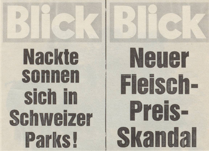
Diese zwei Aushangplakate sah ich am 19. August 1981 an einem Zürcher Kiosk. A. Bärlocher, Zürich

Me muess halt rede mit de Lüüt? Schon recht. Aber wer hört uns eigentlich noch zu? Es lebe die Indifferenz! Die Elektronik macht's wieder einmal möglich.