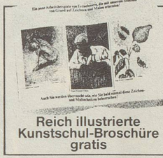
Reich illustrierte Kunstschul-Broschüre gratis

Die Neue Kunstschule Zürich gliedert sich in 4 spezielle Abteilungen: Abteilung