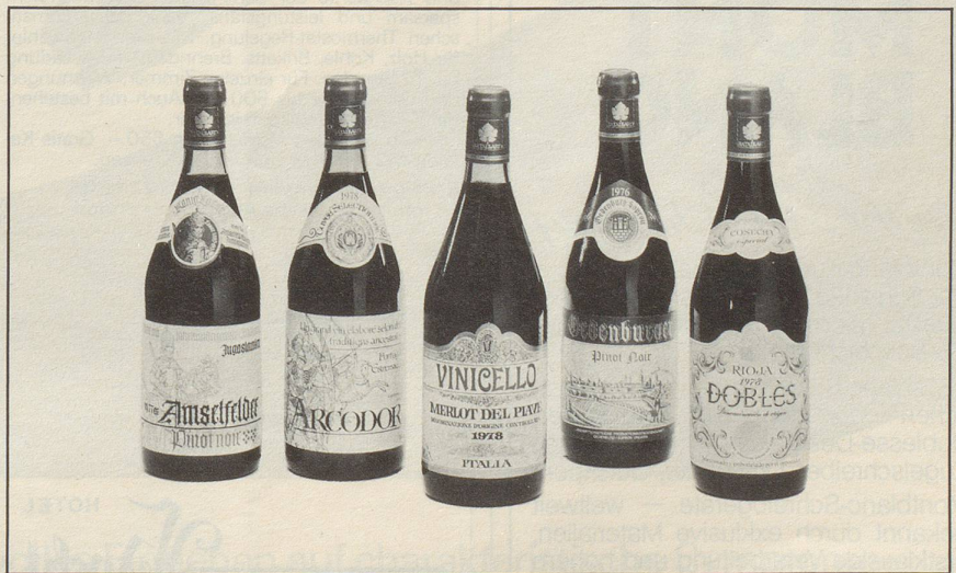
Die in Ljubliana seit 5 Jahren ausgezeichneten Weine mit dem goldenen Rebenblatt (v.l.n.r.): Amselfelder (Jugoslawien), Doblès (Spanien), Arcodor (Portugal), Oedenburger (Ungarn), Vinicello (Italien).

schungen erbringt die alljährlich stattfindende Weinmesse in Ljubliana, wo Weine aus ganz Europa von international anerkannten Weinexperten gestrenge Tests unterzogen werden. So wurden beispielsweise die vom Schweizer Weinhaus Bataillard in Rothenburg LU eingereichten Weine in den letzten fünf Jahren mit nicht weniger als 10 Goldmedaillen und 11 Silbermedaillen ausgezeichnet. Diese Weine – sie werden aus Spanien, Italien, Portugal, Jugoslawien und Ungarn importiert – tragen am Flaschenhals ein goldenes Rebenblatt, das Zeichen für qualitativ hochstehende, doch preiswerte Weine. Zudem sind die Weine mit dem goldenen Rebenblatt eine echte Alternative zu unseren knappen und somit teuren Schweizer Weinen.