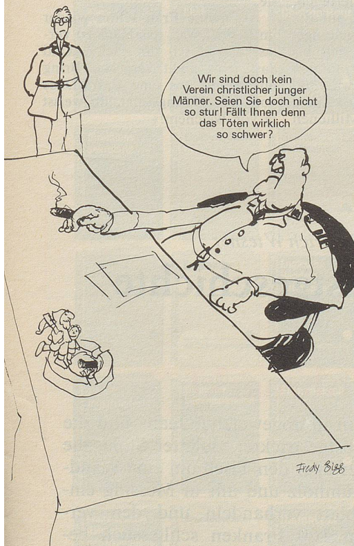
Zwei junge Männer mit tadellosem Leumund und guten militärischen Führungszeugnissen wurden zu Gefängnisstrafen verurteilt, weil sie sich in die waffenlose Sanität umteilen lassen wollten ...

Diese Karikatur in Nr. 7 veranlasste einige Leser zum Protest und zur Abbestellung.