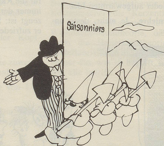
Unsere Heizelmännchen im Frühling ...

Hotel und Solbad, 4310 Rheinfelden. Persönliche Ambiance und Betreuung. Herrliches geheiztes Soleausbaden. Alle Therapie im Hause. 061/87 54 04.