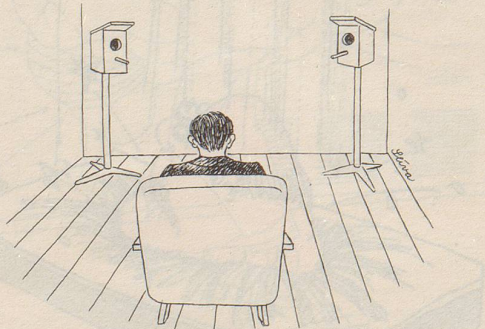
Illustrationsprobe aus «Concerto humoroso»