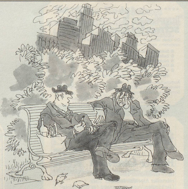
«Dann dachte ich: Zum Teufel mit den Aktien! Und investierte fortan nur noch in Schnaps.»

Seither wundert sich die Welt, dass die Friedenstauben plötzlich als ausgestorben gelten.