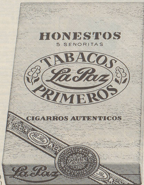
Honestos (Senoritas) 5 Stück Fr. 3.50