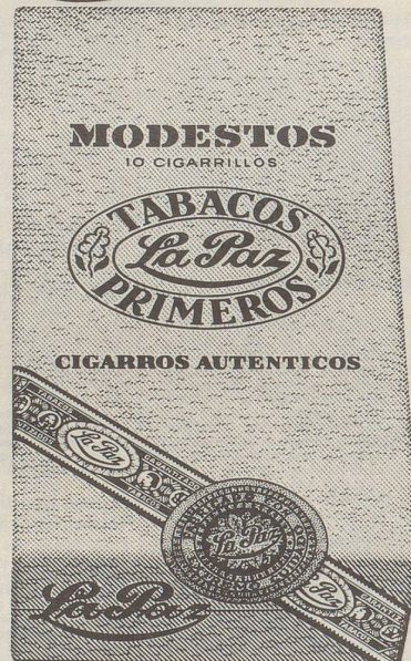
Modestos (Cigarillos) 10 Stück Fr. 4.-