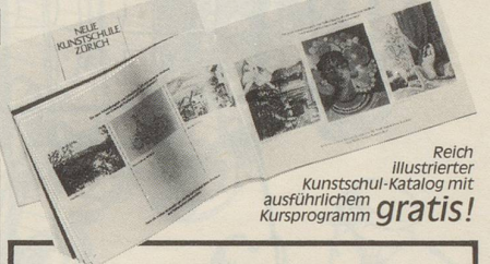
Reich illustrierter Kunstschulkatalog mit ausführlichem Kursprogramm gratis!