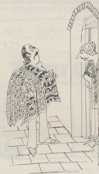
«Persisches Muster? Sie meinen für persisches Rohöl?»

So einfach gestaltet sich die politische Richtungssuche. – Ist das geistige Landesverteidigung, Stil 1982? Im Dienste einer uralten Demokratie?