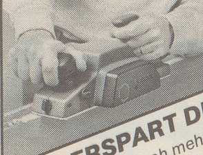
Türen kürzen, schnell und mühelos

DER HOBEL IM HAUS ERSPART DEN ZIMMERMANN! Ein starker, präziser und schneller Arbeiter: der neue Elektrohobel DN 750. Nun sind Sie für alle anfallenden Hobelarbeiten optimal ausgerüstet. Türen kürzen, Oberflächen glätten, Möbel herstellen: Mit kraftvollen 470 Watt, einer stufenlos einstellbaren Spanabnahme von 0-1,5 mm, einer Falztiefe von 20 mm und einer Hobelbreite von 75 mm schafft der DN 750 ein schön breites Stück!