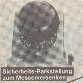
Sicherheits-Parkstellung zum Messerversenken