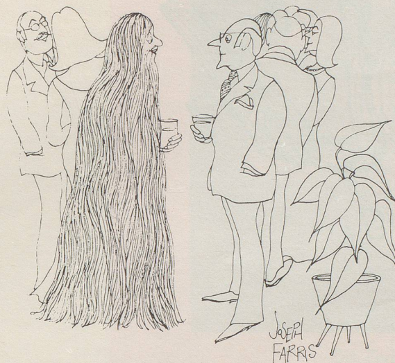
«Damit spare ich erheblich: Coiffeur, Hemd, Krawatte, Jacket und Hose ...»