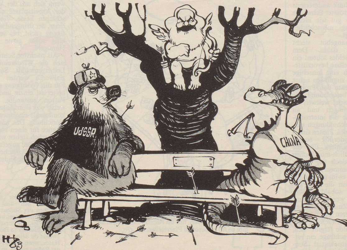
Love story 1983?