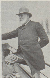
Bundespräsident Emil Frey von Münchenstein (Baselland), 1863 Major der US-Armee, Freund des amerikanischen Präsidenten Grant. Als Gefangener im berühmten Libby-Gefängnis der Südstaaten (fr)ass Frey Ratten.