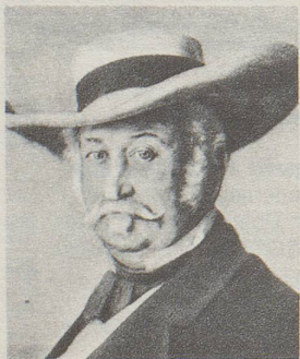
General Johann August Suter von Rünenberg im Baselbiet, Gouverneur des Staates Kalifornien. Weil auf seinem Land Gold gefunden wurde, geriet Suter ins Unglück.