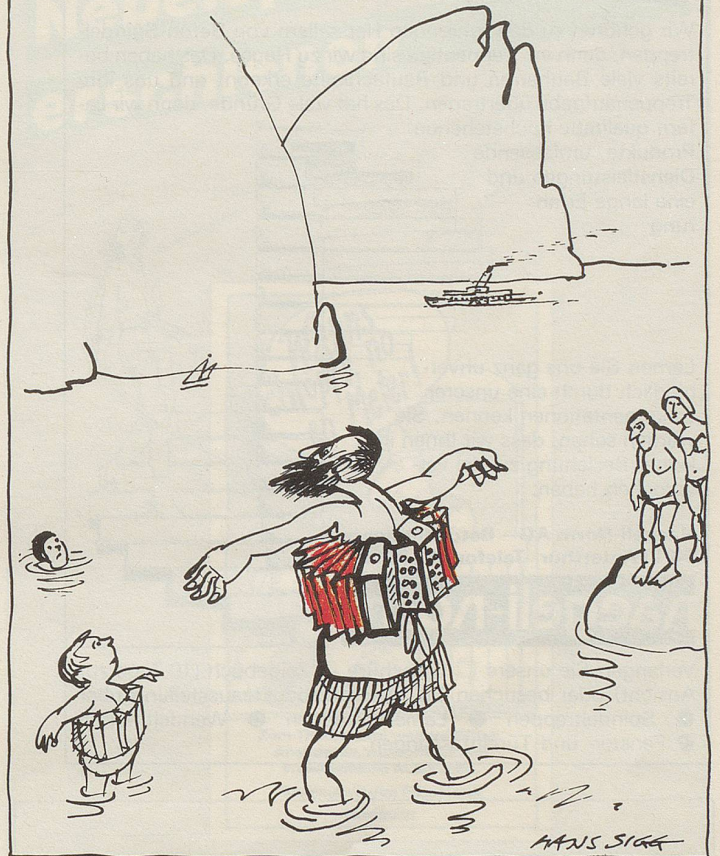
Anfänger auf dem Vierwaldstättersee

Ein Kunstfreund fragt in einer Galerie: «Ist dieses Bild denn wirklich von Hodler?» Antwort des Galeristen: «Mindestens Hodler!»