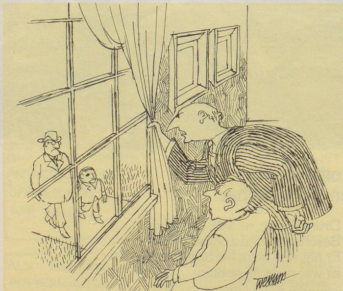
«Es ist doch nicht der Sohn des Steuerkommissärs, von dem du gesagt hast, du hättest ihn eben verprügelt?»

Ende Jahr werde ich Bilanz ziehen müssen.