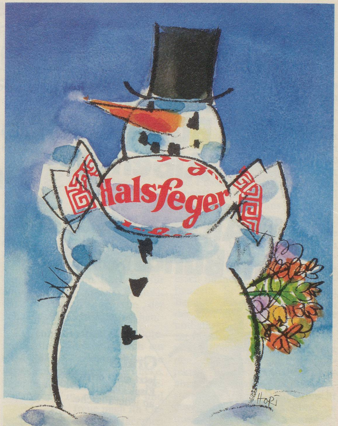
André Klein AG, Neuwelt

E in Finanzmann trifft den andern. «Ich freue mich, Sie endlich einmal wiederzusehen. Gehen wir etwas nehmen!» – «Wem?»