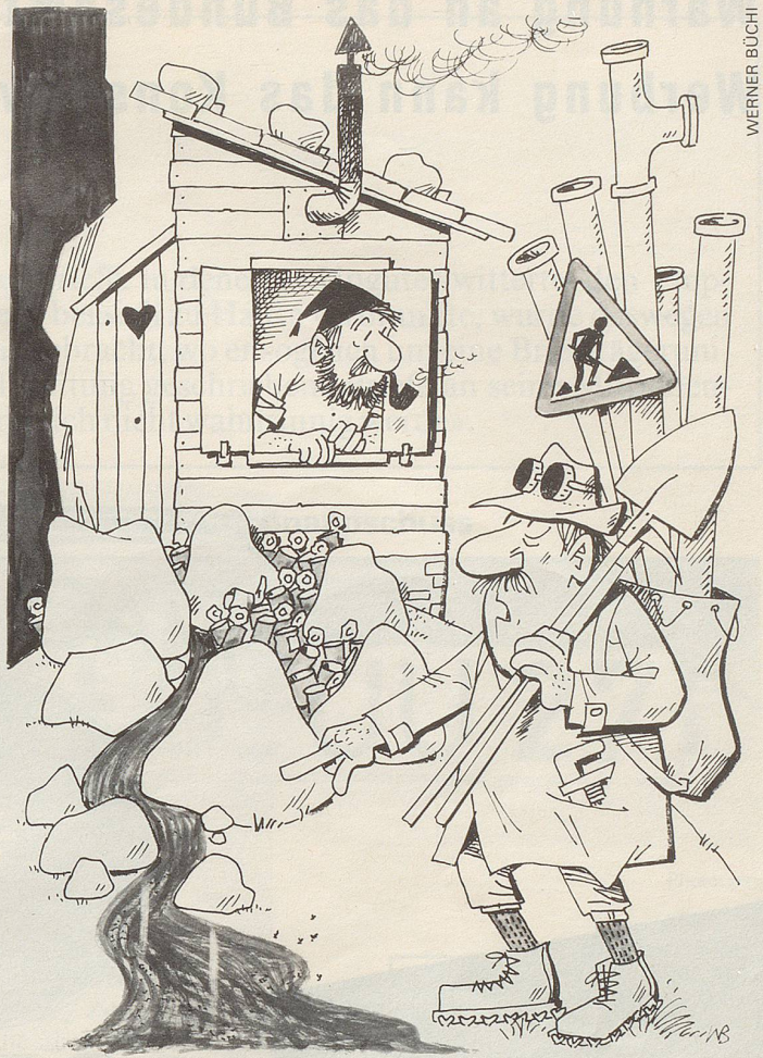
Auch der Schweizer Alpenclub will künftig die Abwässer aus seinen Berghütten in Kläranlagen leiten.

An ein Aufrunden der Note ist in absehbarer Zeit nicht zu denken. Für Nachhilfestunden mag es ausserdem zu spät sein. Aber Naturkunde war ja auch nie ein Hauptfach. Lukratius