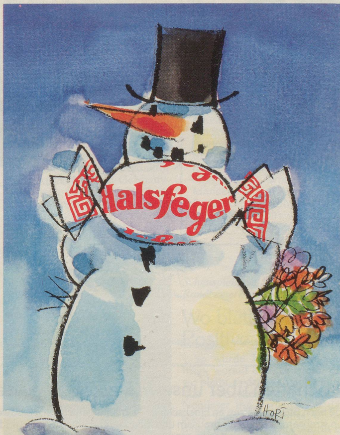
André Klein AG, Neuwelt

Den Staatsbeamten, der das las, erschreckte und verwirrte das; er brach zusammen und verschwand vorzeitig in den Ruhestand.