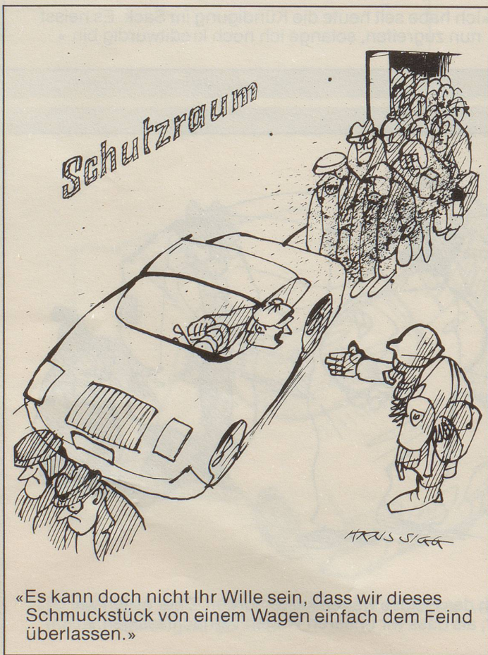
«Es kann doch nicht Ihr Wille sein, dass wir dieses Schmuckstück von einem Wagen einfach dem Feind überlassen.»