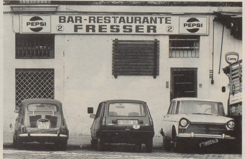
Ein Kommentar zum Namen dieses Restaurants in Barcelona erübrigt sich wohl ...