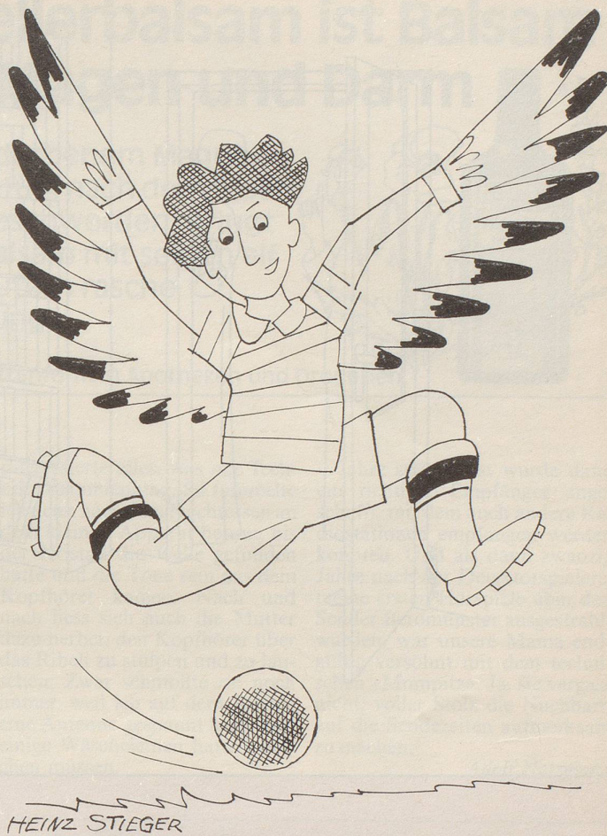
Der rechte Flügelstürmer

Er war immer unterwegs, bis er unterging.