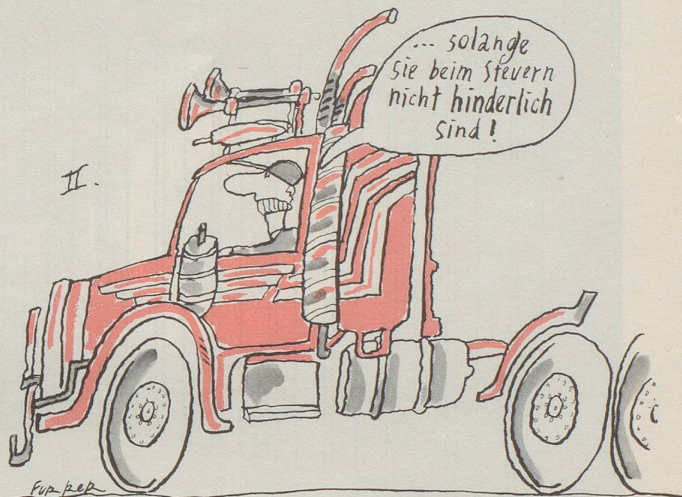
Lastwagen-Chauffeure drohen mit Blockade