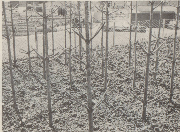
... als Bohnenstangen