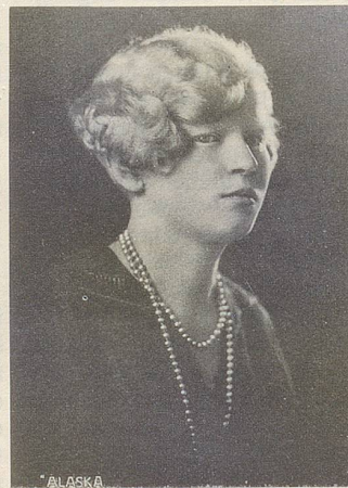
Sie war besonders vielseitig: Unter dem Namen «Alaska» trat diese junge Dame um 1912 als Albino-Lady «mit den weissen Haaren und den roten Augen» auf und übte sich coram publico in Graphologie und Chiromantie.