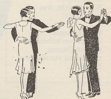
Fig. 40 Fig. 41

*Es wird empfohlen, sich hier der bewährten und noch in fast jedem Brockenhaus erhältlichen 78er-Erfolgsplatte «Billet-doux-Tango» von M. J. Mayson (Phovox 713.854) zu bedienen.