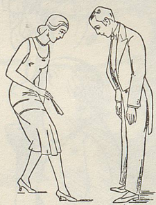
Fig. 38 Fig. 39

«Jedem Tanz zu zweien geht eine Aufforderung zum Tanz, die durch eine Verbeugung ausgedrückt wird, voraus», erinnert uns S. Jaffé. Weiter geht's: «Bei den Gesellschaftstänzen legt der Herr seinen rechten Arm um die Taille der Dame, sie –» Halt, Alfred, um die Taille ! Du weisst genau, wo die Taille ist, viel weiter oben! Ja, dort!