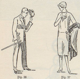
Fig. 36 Verbeugung bei einer Begegnung

Nicht zu verachten ist bereits ein Blick ins aufschlussreiche Vorwort: «... Das Wesen der Neger spiegelt sich in dem Tanz wider, wie das bei allen National-