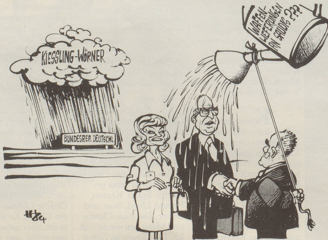
«Das Wetter in Deutschland war auch nicht besonders!»