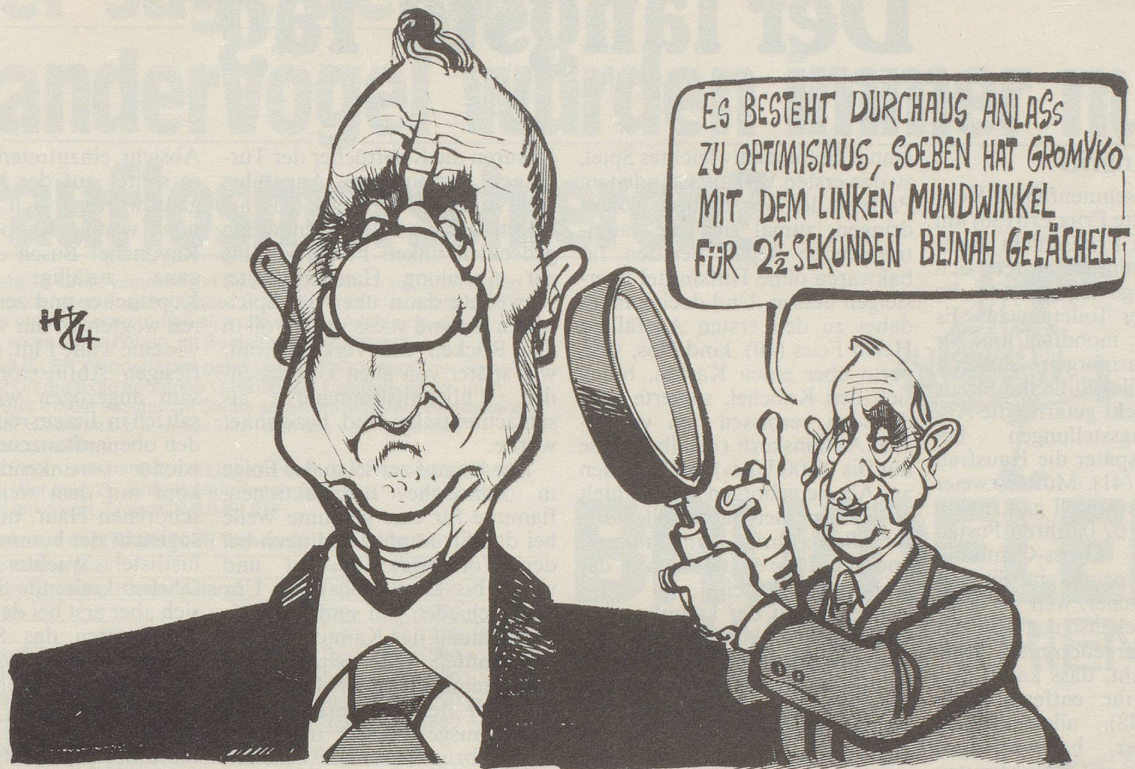
Lagebericht aus Stockholm