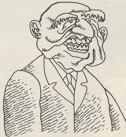
«Aber ich lächle doch bereits!»

Eine solche Lebenshaltung täte vielen Menschen gut.