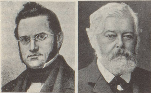
Dr. Jonas Furrer, der erste schweizerische Bundespräsident, stammte aus Winterthur. Auch Dr. Ludwig Forrer war Winterthurer und Bundespräsident. 1912 empfing er Kaiser Wilhelm II. bei seinem Staatsbesuch in der Schweiz.