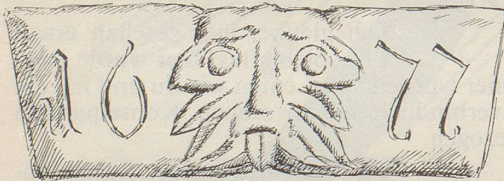
Auch Winterthur kannte wie Basel seinen Lällekönig. Er lällte früher am Hause zur «Windmühle» an der Ecke Steinberg-/Steiggasse.