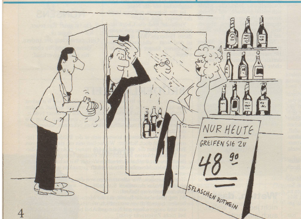
4 Auch die so beliebten Lockvogel-Angebote sind untersagt.