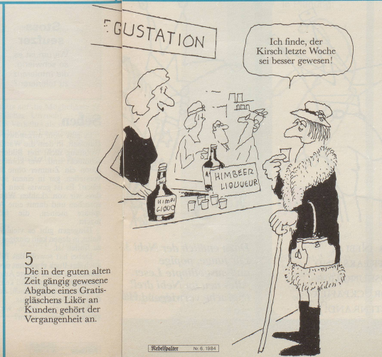
5 Die in der guten alten Zeit gängig gewesene Abgabe eines Gratisgläschens Likör an Kunden gehört der Vergangenheit an.