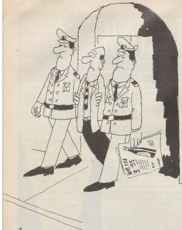
1 Dass das neue Alkoholgesetz (von 1983) seine Tücken hat, erfuhr ein Grossverteiler. Ein Strafverfahren wurde gegen ihn eingeleitet, weil er in einer Zeitungs-Spirituosens-Reklame Preisangaben gemacht hatte.