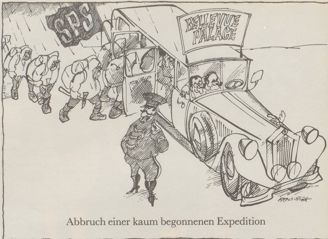
Abbruch einer kaum begonnenen Expedition

Was ist paradox? Wenn einem kaltgestellten Politiker der Boden unter den Füssen zu heiss wird.