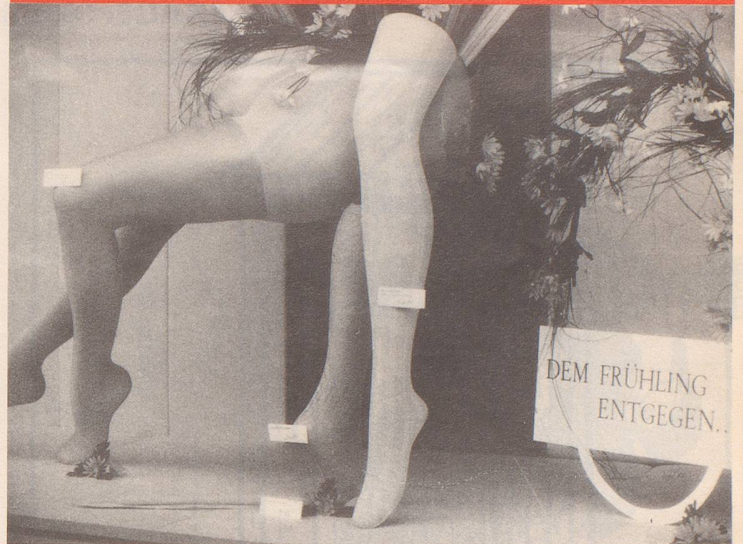
Diese Zeichen trügen kaum ...