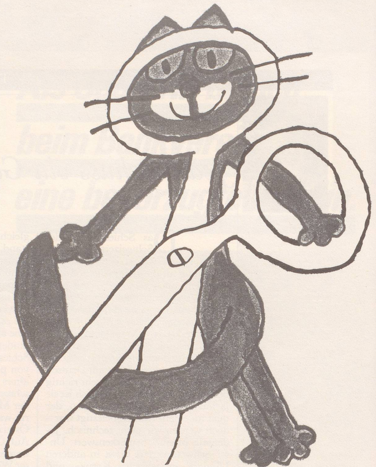
Das Festival-Symbol – eine Katze oft mit Schwanzstoppel – ist auf einen typischen hiesigen Witz zurückzuführen: Man schneidet hier den Katzen den Schwanz ab, damit sich winters die Tür schneller schliessen lässt, wenn man die Katze aus der Stube lässt, ergo weniger Wärme verloren geht.