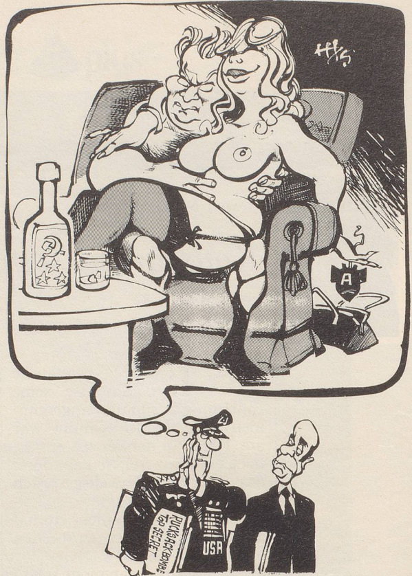
«Und dann haben wir noch die Handtäschchenbombe, die wir per Callgirl in den Kreml schmuggeln können!»