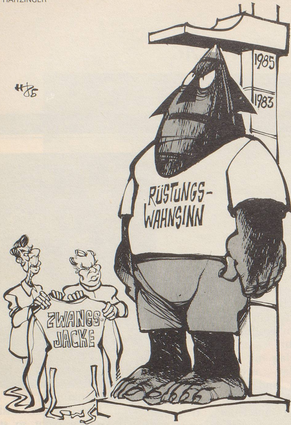
«Vor 13 Monaten haben wir ihn zwar nicht reingebracht, aber jetzt geht's sicher leichter!»