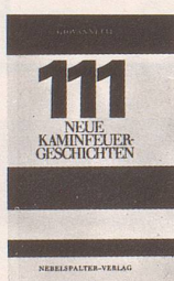
Giovannetti 111 neue Kaminfeuer-geschichten Fr. 14.80

Für den Liebhaber skurriler Poesie sind sie zum Begriff geworden, die «Kaminfeuer-geschichten» mit dem Markenzeichen «Giovannetti». Im zweiten Band dieser Fabeln und Parabeln lädt der Autor zu «Flügen durch die Welt des Innern» ein. So lernen wir, indem wir die Selbstgefälligkeit der im Buch geschilderten Fabeltiere belächeln, über uns selber lachen.